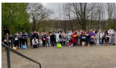
Die Stufe Q2

Unsere Würfel sind gefallen und das Spiel ist beendet. Jetzt fängt das Spiel des ernstesten Lebens an.